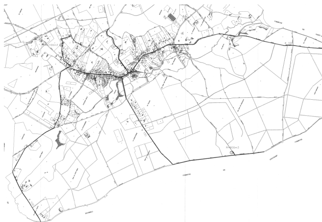
Extrait des périmètres de protection des captages d'eau potable des Yvelines

Le réseau d'alimentation d'eau potable est relativement simple, répartie en 4 branches